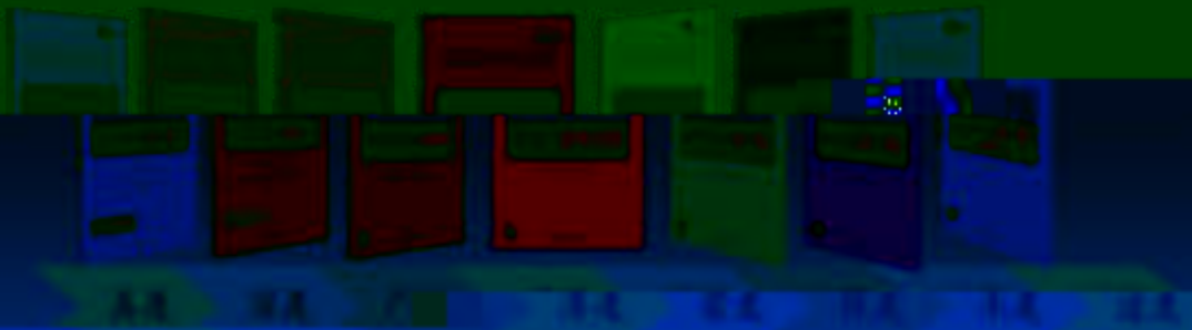
AA 模块 / B 模块 / C 模块 / D 模块 / E 模块 / F 模块 / G 模块 / H 模块